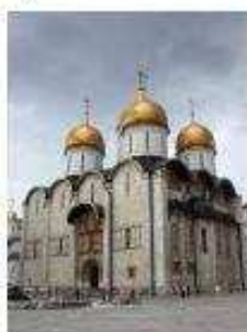
1. Успенский собор в Московском Кремле