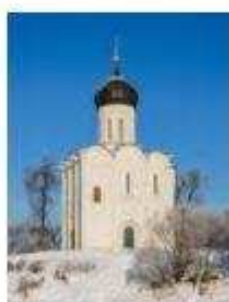
2. Храм Покрова Пресвятой Богородицы на Нерли