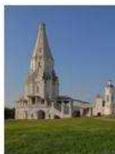
3. Церковь Вознесения Господня в Коломенском (Москва)