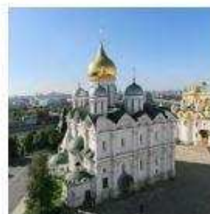
4. Архангельский собор в Московском Кремле